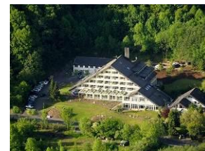
Hotel Rhön Garden Poppenhausen (Rhön) www.rhoen-garden.de

Die Workshop-Hotels, in dem wir den Workshop-Tag gemeinsam verbringen werden, stehen nicht nur für die Qualifizierung im handwerklichen Management, sondern auch für neue Kräfte sammeln, Energien schöpfen, die Seele baumeln lassen, Natur pur genießen, dem Alltag entfliehen, abschalten und sich verwöhnen lassen. Die Hotelteams erwarten Sie!