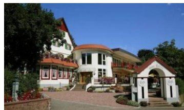
Hotel Ochsen Höfen/Enz (Schwarzwald) www.ochsen-hoefen.de